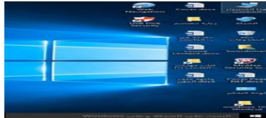
شكل (3.4) فتح مجلد الكمبيوتر

يبدأ فحصنا للمجلدات والملفات والمكتبات بالتشابه عند دراسة مجلد الكمبيوتر. فجميع المجلدات والملفات في جهاز الكمبيوتر مخزنة في مجلد الكمبيوتر. ويمكنك فتح هذا الإطار عن طريق النقر المزدوج في سطح المكتب.