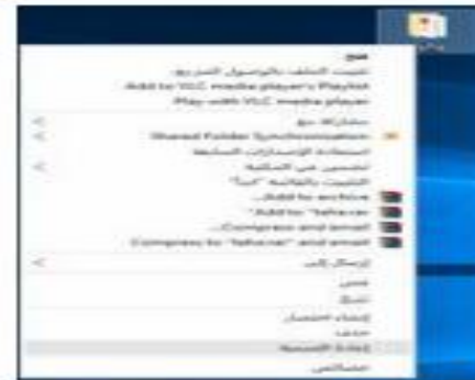
شكل (3.8) اعادة تسمية وحذف مجلد