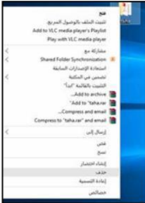
شكل (3.14) حذف مجلد او ملف