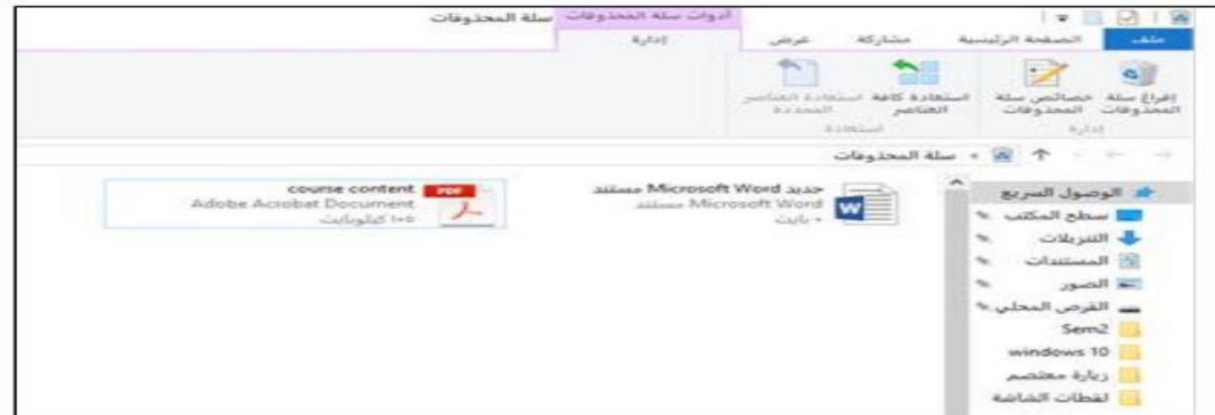
شكل (3.15) سلة المحذوفات