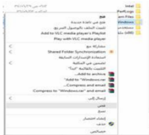
شكل (3.11) قص مجلد او ملف