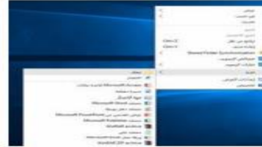
شكل رقم (3.7) إنشاء مجلد جديد