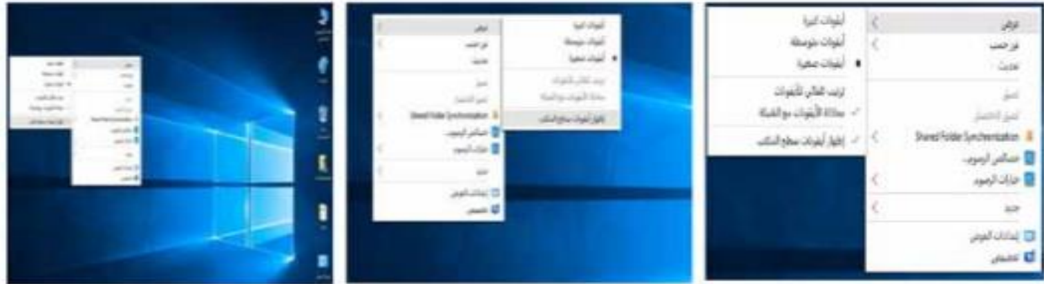
شكل (2.7) إظهار رموز سطح المكتب أو إخفاؤها أو تغيير حجمها

لتغيير حجم رموز سطح المكتب: انقر بزر الماوس الأيمن فوق سطح المكتب، أشر إلى عرض، ثم انقر فوق رموز كبيرة أو رموز متوسطة أو رموز صغيرة.