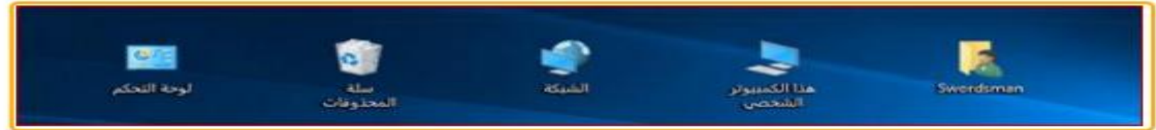
الشكل (2.5) أمثلة لرموز سطح المكتب

تعد الرموز صورًا صغيرة تمثل الملفات والمجلدات والبرامج والعناصر الأخرى. عندما تبدأ تشغيل Windows للمرة الأولى، ستشاهد رمزاً واحداً على الأقل على سطح المكتب، قد تكون شركة تصنيع الكمبيوتر أضافت رموزاً أخرى إلى سطح المكتب. يظهر أدناه بعض الأمثلة لرموز سطح المكتب.