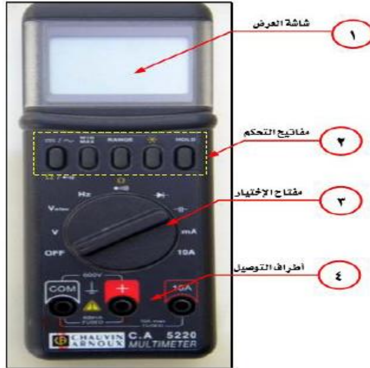
الشكل رقم (٩)

أغلب الأجهزة الرقمية أجهزة متعددة القياسات وتمتاز بدقتها العالية . وتختلف إمكانات القياس من حيث النوع والكمية المراد قياسها حسب طراز الجهاز ورغم ذلك تتشابه أغلب هذه الأجهزة في عملية ضبطها قبل استعمالها في اختبار الدوائر ، والشكل رقم (٩) يوضح أحد هذه الأجهزة ، ولضبطه قبل الاستخدام يجب التعرف على الآتي: