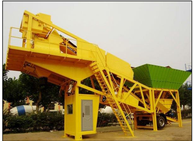
Figure (1) Weigh Batching