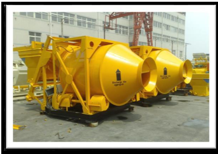
Dual drum mixer