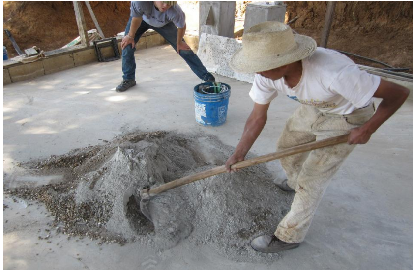
figure (2) Hand mixing

الخلط اليدوي: في هذه الحالة يكون الانتظام أكثر صعوبة للتماسك ، فإن العناية والجهد بشكل خاص ضروريان كما هو موضح في الشكل 2.