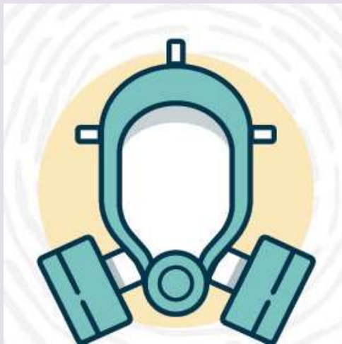
Breathing Masks: Half mask” respirators cover just the nose and mouth; “full face” respirators cover the entire face