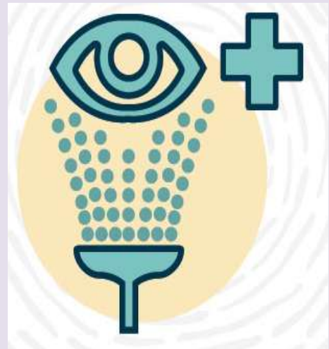
Eye Wash Station