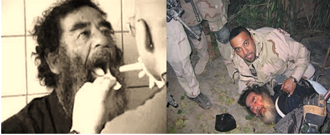
صورة (١-١) تبين إلقاء القبض على المجرم الهارب (صدام حسين) وفحصه طبيا

إحدى الجرائم المنصوص في المواد (١١، ١٢، ١٣)، و هي جرائم الإبادة الجماعية، والجرائم ضد الإنسانية، وجرائم الحرب، وانتهاكات للقوانين العراقية لمجرمي نظام البعث وحزبه ممن ارتكبوا تلك الجرائم بدأ من تاريخ ١٧-٧-١٩٦٨ ولغاية ١-٥-٢٠٠٣ في جمهورية العراق أو أي مكان آخر.