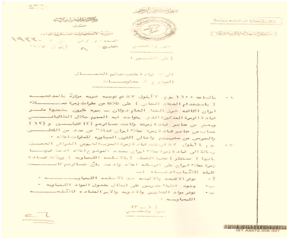
صورة (٢-١) وثيقة جريمة أنفال نظام البعث ضد الشعب الكردي في شمال العراق

الفيليين من الباب الخلفي لقاعة الاجتماع ، والتوجه بهم في باصات مختصة نقلتهم على الفور الى الحدود العراقية الإيرانية، فتم طردهم من وطنهم العراق وهم لا يحملون إلا هوياتهم ومفاتيح سياراتهم.