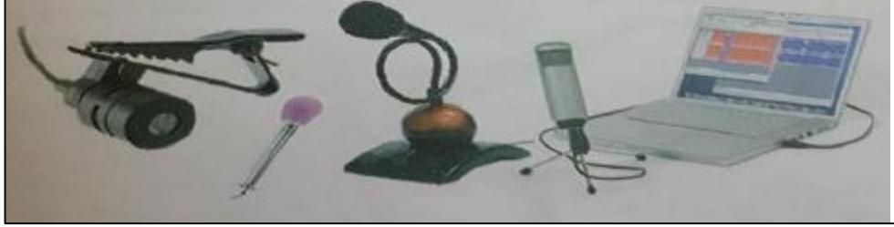
الشكل 5: اشكال مختلفه من المذياع

يستخدم لأدخال الاصوات للحاسوب وذلك لغرض تسجيلها أو معالجتها ويتم من خلاله إدخال الاشارات الصوتيه للحاسوب وبأستخدام البرامج المناسبه كما يمكن ادخال حديث مباشره تاي الحاسوب وتحويله الى نص بأستخدام برامج خاصه كما في الشكل أدناه.