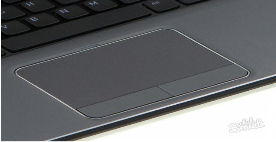
الشكل 1 : لوحة اللمس

هو سطح حساس لللمس بمساحة عدة سنتيمترات مربعة يمكن استخدامه بدلا من الماوس عن طريق تحريك اصبع على هذا السطح وهي اداة منتشرة في الحواسيب المحمولة ويأتي كجزء واحد في الحواسيب المحمولة ويمكن ان يأتي كجزء يمكن فصله وربطه عن الحاسوب عن طريق منفذ USB مثل الجهاز الذي يستخدم الالكتروني كما في الشكل أدناه .