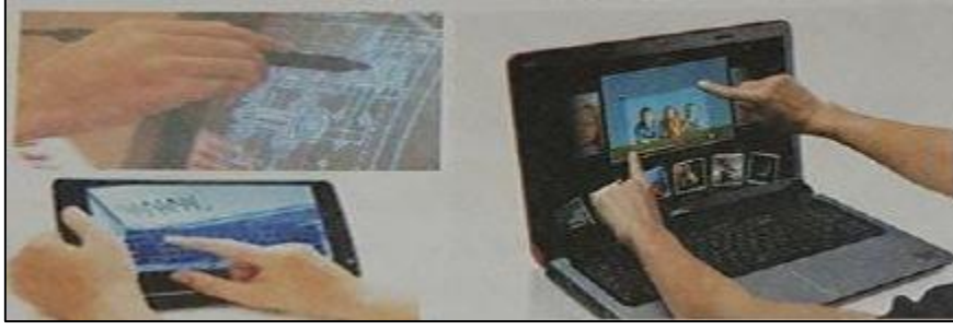
الشكل 2 : يوضح أنواع الشاشات الحساسة للمس