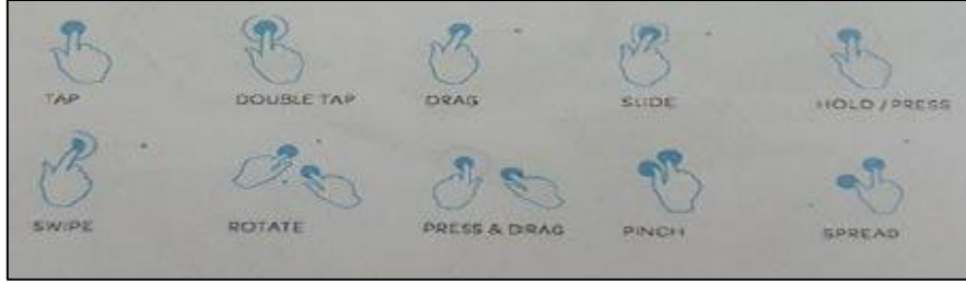
الشكل 3 : حركات اللمس الممكنة على شاشه اللمس