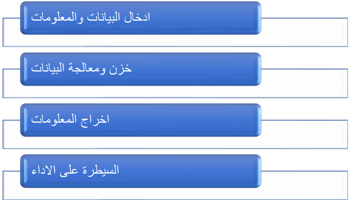
شكل رقم (3) وظائف انظمة المعلومات في المنظمة

4- السيطرة على الأداء: Performance Controls وهنا يتوجب على نظام المعلومات إنتاج تغذية راجعة أو عكسية حول وحدات الإدخال والإخراج والسيطرة عليها من خلال مراجعة التغذية وتقويمها لتحديد فيما إذا كان النظام قادرة على تحقيق الإنجاز بحسب المعايير الموضوعة.