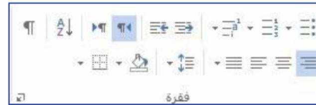
الشكل 2-10 مجموعة فقرة