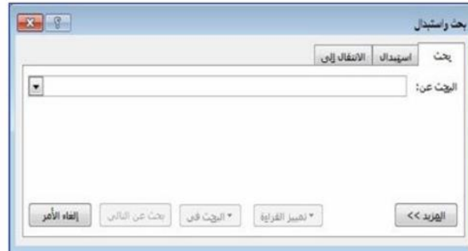
الشكل 13-2 بحث

ii. لإجراء البحث عن كلمة داخل المستند نختار بحث (Ctrl+F) ستظهر النافذة التالية اكتب في خانة البحث عن الكلمة المراد البحث عنها وبعد ذلك اضغط على زر البحث عن التالي.