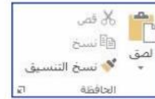
الشكل 8-2 مجموعة الحافظة

i. مجموعة الحافظة: يمكن من خلال هذه المجموعة النسخ والقص واللصق ونسخ التنسيق داخل المستند.