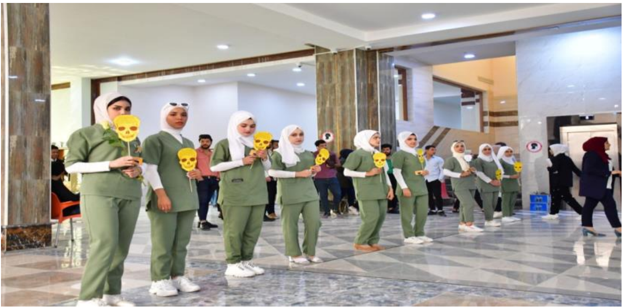
جاناب من طلبة قسم الاشعة والتحضيرات احتفالاً بهذا اليوم