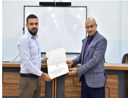
تكريم عدد من المشاركين